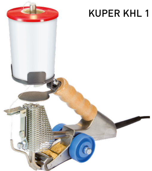
KUPER KHL 1