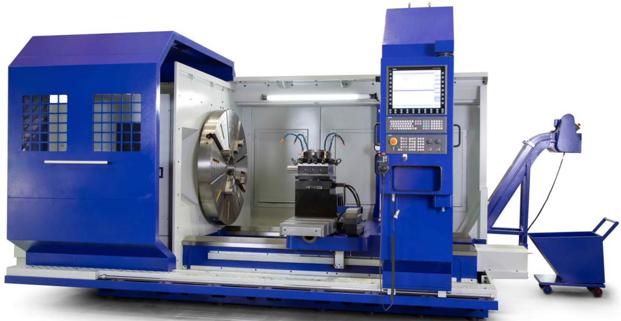
Bild zeigt Maschine mit Sonderzubehör

fabrikneue CNC Kopfdrehmaschine (mit Zyklenunterstützung und ShopTurn) der Baureihe KDB mit CNC-Steuerung Siemens 828 D