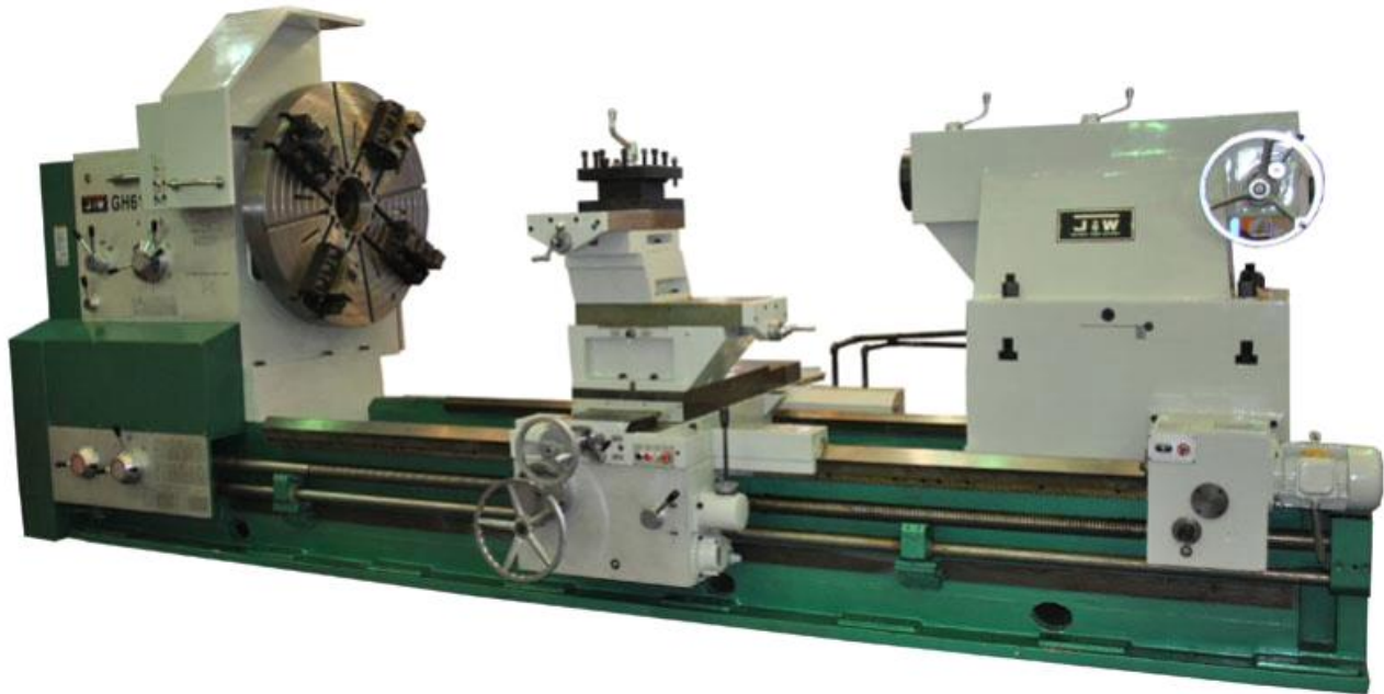
Abbildung SDM-Z 1280

fabrikneue konventionelle Schwerdrehmaschine der Baureihe SDM-Z