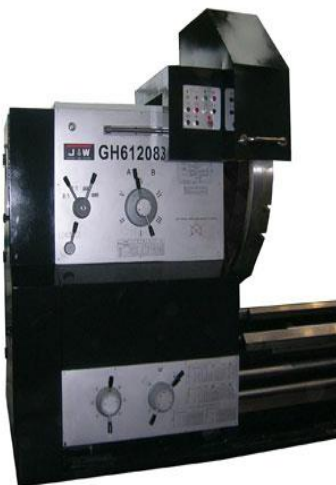
Spindelkasten mit Futterschutz